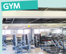
GYM 安全で効果的な有酸素マシン& 筋力系マシン充実