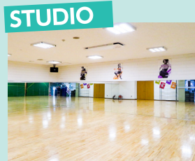
STUDIO 週70プログラム以上ある 多彩なレッスン